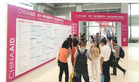
China Aid 开幕