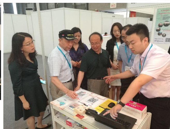
老龄办及民政部中民养老规划院领导 莅临中国养老网展台指导工作